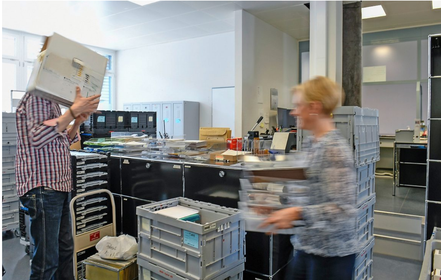
Im Einwohnerdienst wird gleichzeitig gearbeitet und zusammengepackt.

«Die Verschiebung von so vielen Arbeitsplätzen ist aufwendig», sagt Zibung. Schliesslich müssten auch Akten und Archive zügelt werden. Die wichtigsten Voraussetzungen für einen solchen Umzug seien eine gute Vorbereitung und zuverlässige Partner. Gleichzeitig müsse der Dienst für den Bürger sichergestellt werden. «Dem